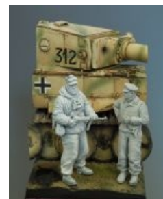
Пример виньетки от фирмы Darius Miniatures

Жанр очень популярный на Западе. Виньетка ещё не является диорамой, но и не просто фигурка. Уже есть свой сюжет, свои детали. Также виньетки менее сложны и занимают меньше времени у моделлиста, чем диорамы. Диорамы можно делать годами, на просто хорошую надо потратить несколько месяцев. Виньетку можно сделать в течении месяца. При этом мелкими деталями она может, если и не превосходить, то поравняться с диорамами точно. Именно поэтому они так популярны.