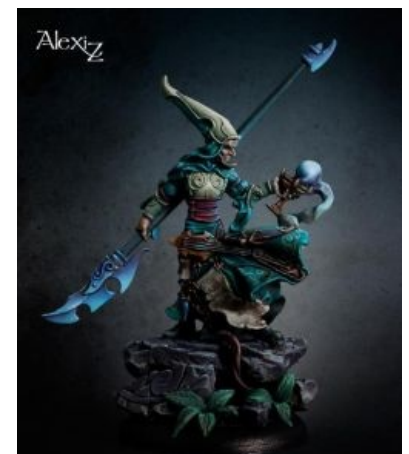
Миниатюра русской бахины Alexi_Z