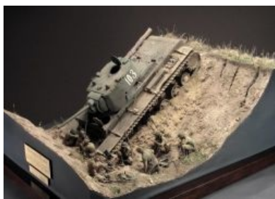
«Донская балка», Автор А.Зеленков.

Диорама (др.-греч. διά (dia) — «через», «сквозь» и ὄραμα (horama) — «вид», «зрелище») — лентообразная, изогнутая полукругом живописная картина с передним предметным планом (сооружения, реальные и бутафорские предметы). В нашем деле представляет собой «вырезанный» момент в пространстве — основание с фигурками, техникой, домами и прочим. Обязательно наличие сюжета. Без него смотрится, как куча непонятного барахла. Также существуют определённые правила, которые нельзя нарушать, иначе потеряется восприятие происходящего, и опять получится то, о чём писалось выше. Например, нельзя, чтобы техника и дома стояли параллельно краям основания. Нельзя, чтобы было слишком пусто или слишком тесно.