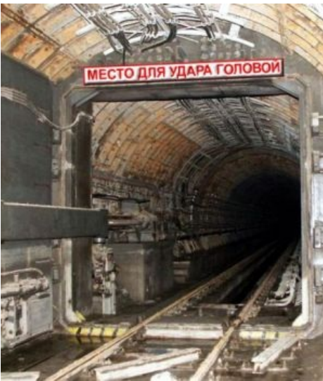
Фото последствия лобового столкновения с гермой в тоннеле