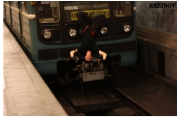
Альпинистам ... есть чем заняться в метро!

https://www.youtube.com/watch?v=KSDmgbgT5us