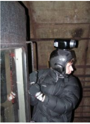
Виден СВЕТ в конце тоннеля!

Мытищинским заводом конструктивные особенности головных вагонов серий Е и 81-717\714, такие как ступеньки и поручни. Дисциплина предусматривает безопасное катание одного-двух человек на хвостовом вагоне (но при желании можно и больше).