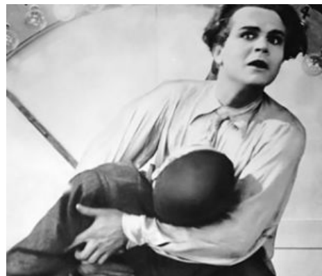
Фредер (Посредник) спасает замученного пролетария от тяжелой работы.

Киборги не дремлют. Марию быстренько похищает изобретатель и копирует ее внешность на своего жено-робота. Заполучив программу, киборг внедряется в общество и начинает подрывную деятельность. Причем одинаково эффективно действует как на быдло, так и на небыдло. Большой дядя и Отец города доволен. Тут стоит заметить, что немногим ранее Фредер увидел отца вместе с робо-Марией, и в результате этого у него слегка подразорвало шаблон... В общем он второй раз стучается башкой. В итоге ему мерещатся Тонкий в образе богослова из церкви, которую Фредер посетил ранее, прося за себя с Марией, плюс сама Мария в образе Вавилонской Шлюхи, а также ожившие статуи семи смертных грехов с потрясающей Смертью в авангарде, весело играющей на костофлейте и размахивающей косой. Потрясающее воображение.