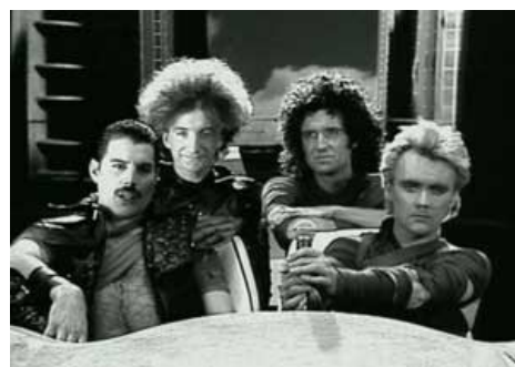
Queen знали толк в Метрополисе.