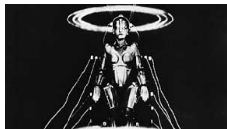
Так в древности в робота загружали операционную систему и наращивали биооболочку.