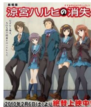
Ицки, Юки, Кён, Харухи, Микуру