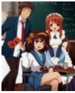
Кён случайно попал в кадр