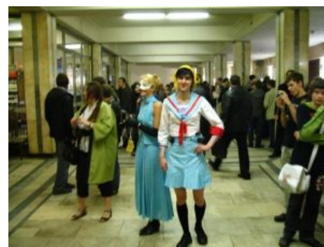
Русский косплей, бессмысленный и беспощадный

В 2007 году Reanimedia сделала дубляж на тот момент первого сезона, дико доставивший хорошими