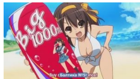
Product placement в Lucky Star

Из аниме была вырезана сцена с распитием бригадой спиртных напитков, но в «Исчезновении...» Харухи тем не менее этот момент упоминает [3] .