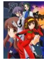
Neon Genesis Haruhilion