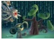
Вольное переложение с поправкой на Успенского