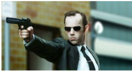
Местный шут-циркач Агент Смит

изображая чёрную сороку, бить противников пяткой в лоб . «Избранница» «Избранного». Алсо, обладательница ног в стиле «плоскогубцы».