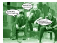
Omsk has you