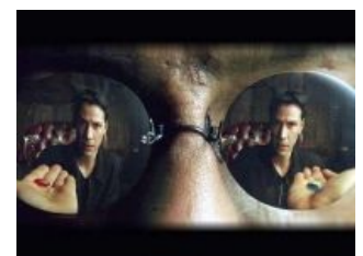
Take the Blue, you'll