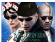
Расово укрская матрица