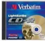
Матрица для записи приколов