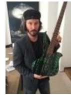
Матричная гитара (Кто написал «Гитара»? Davie504 негодует!!!)