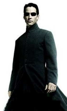
Бравый Нео в подрянике

Нео , он же Том Андерсон, — главге-й, помощник команданте Морфеуса . До своего чудесного пробуждения жил одновременно в двух местах: Матрице, где работал скромным программистом и подрабатывал хЭккерством , и, собственно, на Елисейских полях роботов, где его периодически подкалывали живительным эвтаназепамом . После пробуждения занимается тем, что периодически получает пиздюлей от компании «Смит и Ко» и раздает их всем прочим. Ровно до того момента, как уже наконец станет героем в расово правильном смысле этого мема, да вместе с собой схлопнет и всю «Ко. и Смит». Кстати, в одной из серий Южного Парка Киану Ривз , игравший не раз спасителей и мессий, назван секретным оружием Б-га.