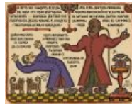
Матрица православная, автор Андрей Кузнецов