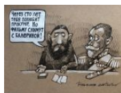
Распутин предсказывает будущее