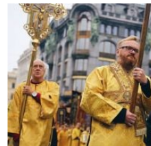
Его Воробейшество и святой преподобный отец Пигидий на крестном ходе в Питере

Ещё в январе 2017 года появилась инфа , что активисты незарегистрированной организации «Христианское государство — Святая Русь» (пока ещё разрешённая в России организация) разослали в российские кинотеатры угрозы с требованием отказаться от проката «Матильды» . В противном случае кинотеатры пообещали сжечь КЕМ . Теперь уже режиссёр Алексей Учитель пошел жаловаться в Генпрокуратуру, а последняя в свою очередь таки нашла в действиях активистов состав преступления.