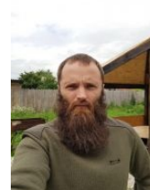
«Православная страна должна быть такой, как Иран! »

А в ночь на 11 сентября около офиса адвоката Учителя загорелись два автомобиля . Совершенно случайно рядом с ними стояли с лозунгом «За „Матильду“ гореть». После сего события предварительный показ «Матильды», который должен был прийти в кинотеатре «Иллюзион», перенесли на неопределённый срок. А объединённая сеть кинотеатров «Синема Парк» и «Формула кино» и вовсе отказалась от показа «Матильды», мотивировав свой отказ тем, что они хотят показывать кино, а не фаер-шоу.