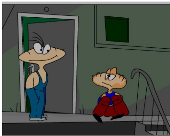
Хрюндель и Лохматый