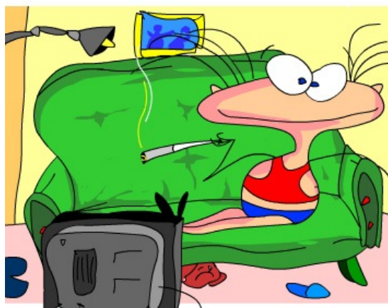
Масяня смотрит телек

Извращение персонажа автору пришлось очень не по нраву, особенно когда унулый канал «ДерьМузТВ» внаглую его украл и озвучил голосом петросяна Павла «Муха, сука!» Воли. Такая коммерциализация была явным нарушением масянской сути, ибо в программу «В гостях у Масяни» ведущая приглашала самых раскрученных попсовиков, хотя оригинальная героиня была абсолютной попоненавистницей, Куваев решил подать в суд и выиграл дело.