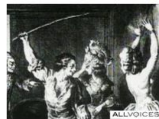
Фото с места событий