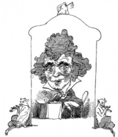
Карикатура на де Сада

«Но зачем тебе деньги, Жозефина? На тряпки? А мне они нужны на задницы, на мужские члены. Видишь, какая большая разница! »