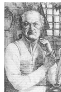
Маркиз де Сад с презрением смотрит на бездуховную чернь.