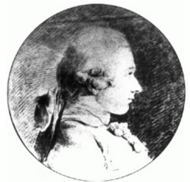
Donatien Alphonse François de Sade

Маркиз де Сад ( Донасьен Альфонс Франсуа де Сад , фр. Donatien Alphonse François de Sade ; 1740—1814) — французский писатель, философ, циник и дебошир, любитель театра и превосходный актёр, человек с противоречивым характером, буйной фантазией и добрым сердцем. Истинный аристократ, отпрыск древнего и знаменитого рода. Проповедовал освобождение человека от гнёта устаревшей морали и религии. Впрочем, предтечей сабжа можно считать жившего в 17 веке Джона Уилмота , по мотивам насыщенной жизни которого даже был снят фильм The Libertine , с Деппом и Малковичем в главных ролях.