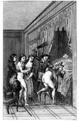
Та самая вечеринка

«Маркиз де Сад, до конца испивший чашу эгоизма, несправедливости и ничтожества, настаивает на истине своих переживаний. Высшая ценность его свидетельств в том, что они лишают нас душевного равновесия. Сад заставляет нас внимательно пересмотреть основную проблему нашего времени: правду об отношении человека к человеку.