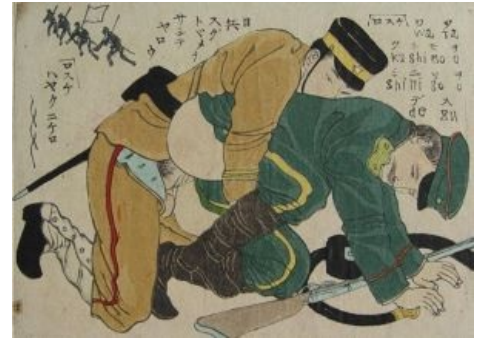
Результат маленькой победоносной русско-японской войны 1904—1905 годов

Так что шансы получить на выходе fail очень велики.