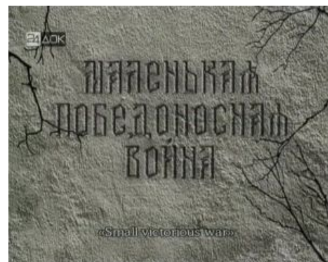
small war такая small