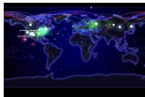
Сценарий начала самой быстрой победоносной войны by DEFCON