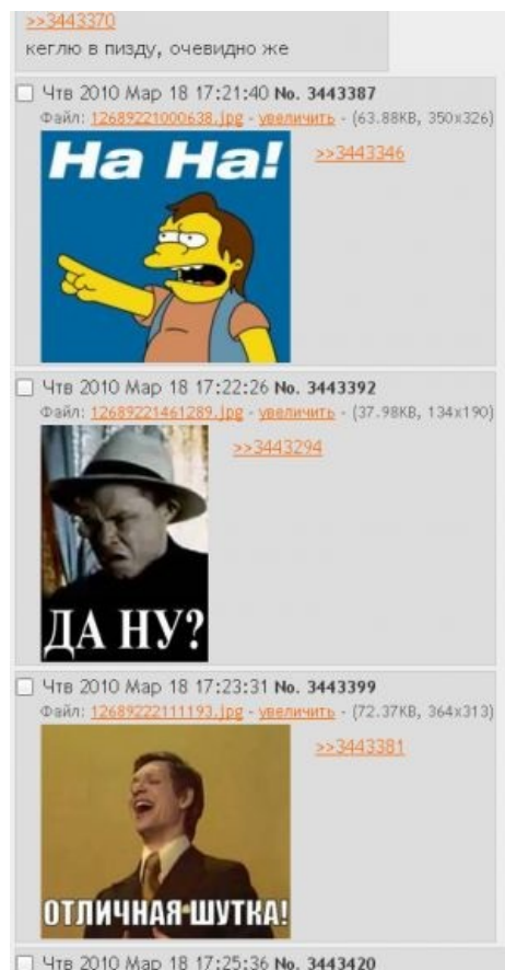
Пример общения при помощи макросов