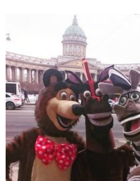
Из палаты мер и весов.