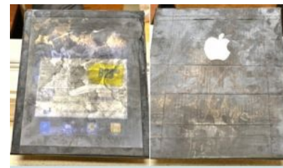
Деревянный iPad, только что из магазина

На дворе стоит 2007 год. Птички поют, солнышко светит, девочки юбочки задрали. К вам подходит на рынке парень — гопообразный , биланообразный , гастарбайтер , да хоть какой с виду. Говорит: «Хош купить телефон, Нокья N95, по дешману отдам, за чирибас, а ты потом его за 40 тысяч продашь!» На деле это никакая не N95, а наигрубейшая босотовая китайская подделка , похожая на него лишь внешне, да и то с расстояния пушечного выстрела. Данное изделие совершенно никакое по части аппаратного обеспечения, русский перевод прямо-таки дебильный как в инструкциях к шмоткам с рынка, устройство перестает работать через месяц, если повезёт. Обычно в первые два дня. А продавец имеет неплохой навар. Было замечено и в 2008 году, потом «волки-одиночки» переключились на босотовые копии Айфонов . К примеру . Сейчас подобного рода наглость в ДС практически вымерла, торгуют чайнапромом непосредственно с лотков в метро, так как клиентура пока находится. Но в замкадсках, например, на Урале и Санкт Петербурге, около центральных рынков ещё вовсю тусуются хачи и гопники с предложением купить у них якобы Samsung Galaxy S4 или Apple iPhone.