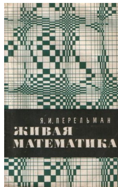
Та самая книга. 10 издание, 1974 год.

Да-да, бывает и такое и отнюдь не редко. В качестве лохотронщиков выступают чинуши , элита , первая леди, королева, нередко — все вместе. Они начинают „социальную программу“, а точнее, обычное выклянчивание у населения денег на