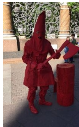
Деньги или жизнь