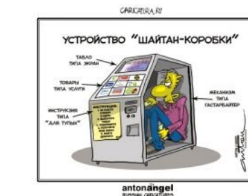
Шайтан-коробка такая коробка.