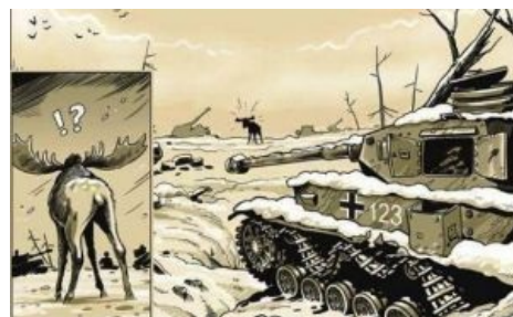
Лось Вотзефак в естественной среде обитания.