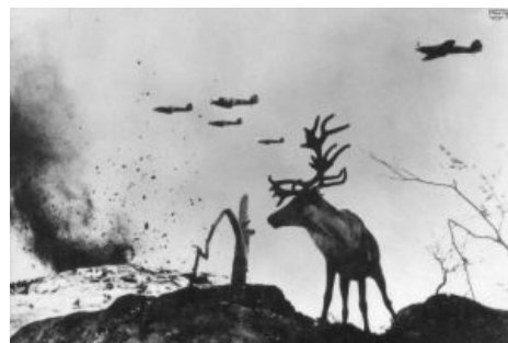
Олень Яша и британские истребители.