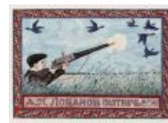
Редкий случай: оружие, изображенное на рисунке, стреляет