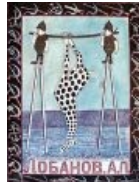
Охотник стреляет жираф хорошо