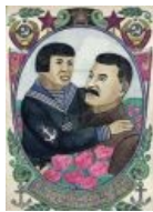
Сталин и тьян (на рисунке нет оружия, прошу заметить)