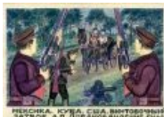
Что-то не вполне внятное