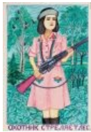
Охотник стреляет лес