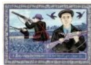
Автопортрет на фоне охотников