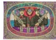
Сталин и Ворошилов