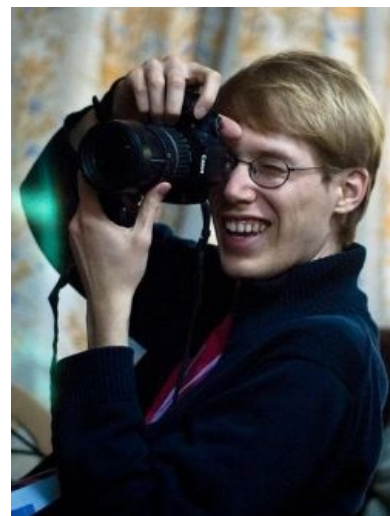
Фото Поттеринга, сделанное неким индусом

«Yes, I Broke Your Network, Your Audio and Your Boot»