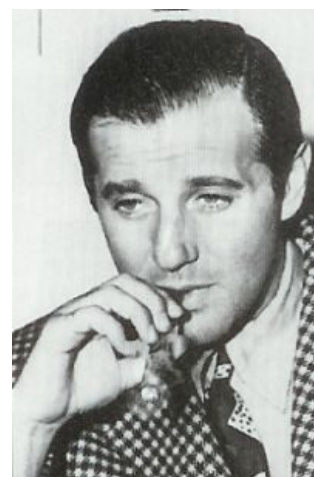
Багси Сигал даже не смотрит на тебя — ему на тебя похуй

«Энтони Спилотро был, вероятно, последним гангстером, имевшим отношение к бизнесу в Лас-Вегасе. В детстве я видел этих парней в щегольских черных костюмах, в окружении проституток и с парой пистолетов за пазухой. »