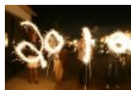
А это фаер граффити