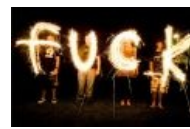
Need I say more?