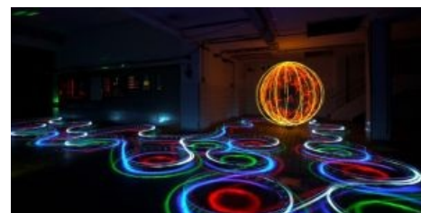
...а это фризлайт

Первый способ является каноничным, собственно, это и есть лайт-граффити, потому что здесь, как и в граффити обычном, рисуются теги, витиеватые слова и прочее, только уже светом, а не краской. А фризлайтом называют изображения, на которых есть осмысленные рисунки, либо абстракция. И это название для световых рисунков более прижилось на территории бывшего Союза. Второй описанный способ назвали люминографией, есть ещё и фаер граффити, когда рисуют фейерверками, и лайт-стенсилс, когда рисуют вспышками через трафарет.