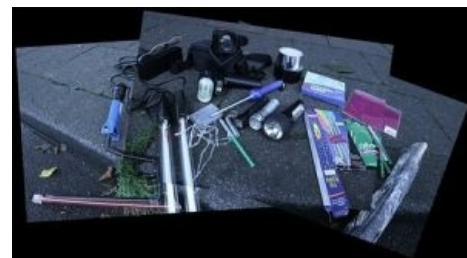
Всё, что для этого нужно

Первый способ следующий. Нужно взять фотокамеру, выставить на большую выдержку, предварительно установив на штатив либо другую устойчивую поверхность. Штатив желательно очень хорошо закрепить, чтоб не было вибраций. Выбирается фокусировка (авто или ручная — на выбор), камера устанавливается в режим максимальной покадровой съемки, а дальше начинается, собственно, рисование. Рисовать можно не только фонариком, но и мобилкой, фейерверками, спичками и всем другим, что светится. В итоге из-за большой выдержки движущихся фигур практически не видно, срабатывают законы физики и на самом кадре видно лишь рисунок из световых линий.