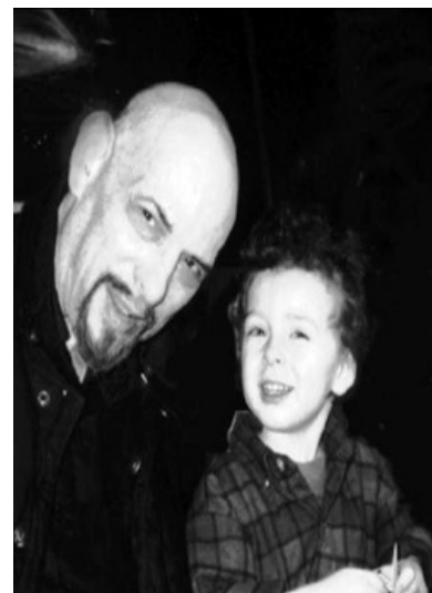
Папа и сын. Смотрят на тебя, как на ЕДУ ! Оба

Автограф. «La Vey» вроде бы написано отдельно, но это не точно