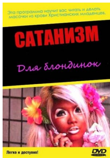
Пособие для эстеток