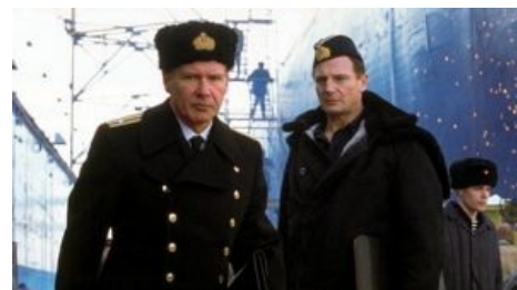
Хан Соло и Квай-Гон спасут мир