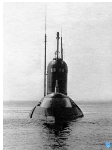
Смотрит на тебя как на американца...

15 ноября 1969 года во время очередного похода, К-19 меняла глубину, и убрала носовой частью американскую ПЛ «GATO». Оказалось, что американцы вели подводную разведку в Баренцевом море, на берегах которого коварно расположилась Империя Зла. К-19 же, хоть и с повреждениями, осталась на плаву и вернулась на базу. Позже стало известно, что командир торпедного отсека GATO с криком «русские идут» был готов торпедировать К-19, но командир Бухард оттащил ретивого офицера от «кнопки», тем самым, возможно, сэкономив несколько миллионов жизней. Именно с тех пор в ВМФ США ввели запрет на самостоятельные решения офицеров об атаке без разрешения на то командира судна. А на К-19 никто не пострадал, win.