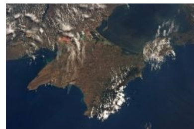
Вид на Крым с НЛО

Крым (укр. Крим , англ. Crimea , хохл. полуостров раздора ) — небольшой полуостров в восточной части Европы. Имеет высокую историческую, туристическую, археологическую и гастрономическую ценности. Практически круглый год там тепло, халявные виноград, инжир и персики. Но более всего занят тем, что всю историю существования на нем разумной и не очень жизни перманентно доставлял баттхерт окружающим землям, да и своим владельцам тоже. Рассмотрим подробнее: