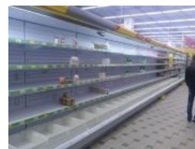
Еще больше голода