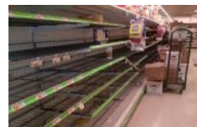
Крымчане голодают! (спойлер: На самом деле — нью-йоркцы)

В конце концов этот форсед-мем так всех заебал, что его использование превратилось в детектор упоротой