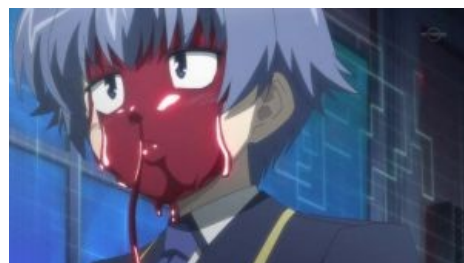
Кота Цутия из «Baka to Test to Shoukanjū»