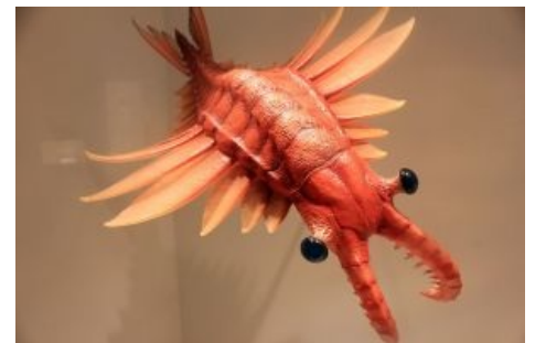
Погладь криветко, сука!