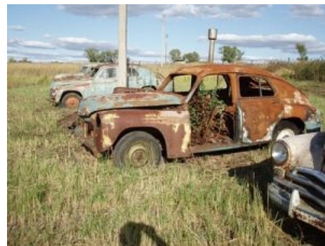
Это музей, да-да!