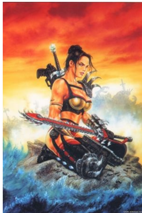
Heavy Metal F.A.K.K.2 — терминальный случай космооперы