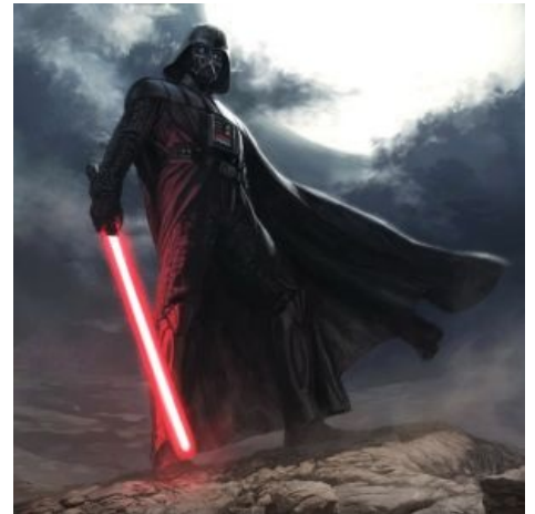
Пафосный ситх пафосен

И понеслось — эстетам Battlestar Galactica (уменьшен градус неадекватности, даже кораблики более-менее правдоподобной формы), олдфагам — пятидесятилетние франчайзы-старички имени Бака Роджерса и Флэша Гордона , в оригинале — вполне приличная НФ. Все полагающиеся штампы жанра присутствовали, а внешнюю похожесть на СтарТрек и ЗВ диктовал рынок.