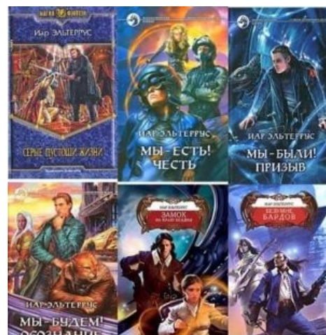
Убил графомана — спас дерево