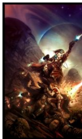
Космоопера — это пафосно. Очень пафосно!