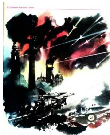
Оборона Фомальгаута. Расчет космического ЗРК. Обратите особое внимание на форму солдат

Самый расцвет жанра совпал с эпохой бурного развития пилотируемой космонавтики, когда человечество