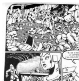
Космоопера — это brutally