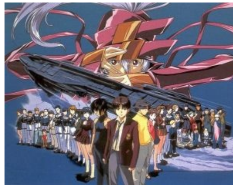
Японцы в теме