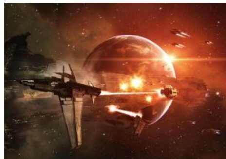
EVE Online — MMORPG в космооперном сеттинге