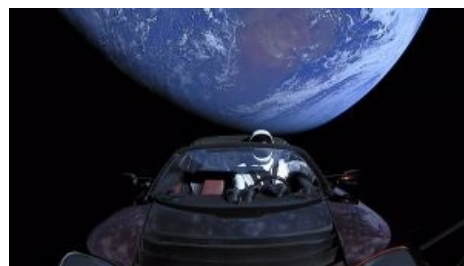
Starliner сваливает с Земляшки на спизженной Тесле

дня после этого заявления SpaceX успешно запустила первую частную сверхтяжелую ракету Falcon Heavy, способную вывести 64 тонны на орбиту или отправить 16 тонн на Марс.