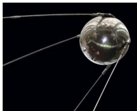
Первый сферический спутник в вакууме. Made in USSR. Он же сперматозоид Циолковского

В начале XX века о постройке реактивных аппаратов для освоения космического пространства задумывались во многих странах. Но наибольшая концентрация теоретиков космонавтики на душу населения почему-то наблюдалась в России ( Циолковский , Цандер, Штернфельд, Кондратюк и др.) и Германии (Зенгер, Оберт, Шершевский, Небель и др.). Первоначально работы этих господ не секретились, но когда в воздухе запахло войной, власти обеих стран задумались — а нельзя ли из пустопорожних мечтаний извлечь какой-никакой профит? Само собой, ни нацисты, ни большевики не думали о полётах на Луну. Они больше задумывались о скорейшей доставке сотен третила до вражеских столиц. Поэтому в 1930-е годы все разработки реактивных двигателей и ракет анально огораживаются , теоретикам приказывают забыть о чувственных