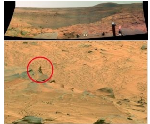
NASA утверждает, что это камень. Фуллсайз смотрите на их сайте