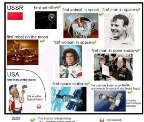
Выиграли космическую гонку

«Луноход-1». Шасси от автострадного танка как-то намекало, кому космос будет в итоге принадлежать. Планы запуска были поистине эпическими: вместе с Луноходом должен был спуститься и аварийный модуль для космонавтов, на случай, если их спускаемый аппарат не взлетит , а также места внутри самой конструкции, чтобы не шляться лишнюю сотню километров пешком по Луне. Впрочем, с полётом людей у СССР так и не сложилось. И, кстати, мало кто знает, что несмотря на то, что этот Луноход был номер 1, на самом деле он был вторым — предыдущий сфейлил, в основном прямо на старте.