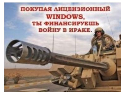
Наш ответ Чемберлену