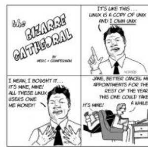
Диагноз Free Software Magazine