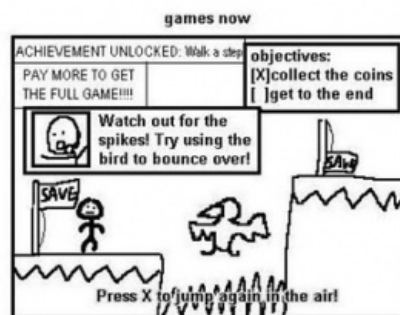
Игры раньше и игры сейчас