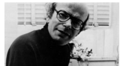
Розенхан: ну и кто тут больной?