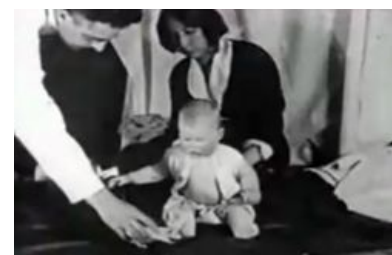
«В пизду хомячка!!!!адын»

А потом экспериментаторы «потеряли доступ к ребенку», видимо, мамаша фалломорфировала от таких экспериментов и отобрала отпрыска. Уотсон и ассистентка мамой клялись, что хотели и собирались избавить ребенка от страхов, но не сложилось, не срослось. А вот пнуть