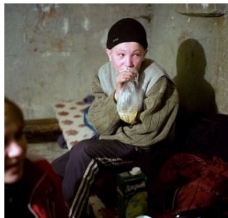
Типичный пользователь применяет сабж по назначению