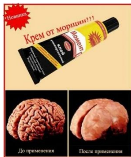
Петросьянство в тему