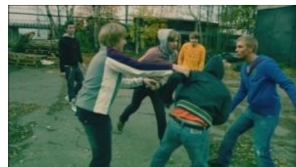
Эстонская школота тешитя

Аннигиляция в школе часто происходит не в результате давления, а просто как красивый жест.