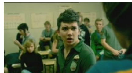
Андерс, типичный представитель