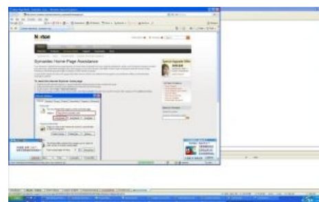
Пингвины пляшут на сайте Symantec.

При запуске setup.exe (а он иногда и самозапускался, как уверяют пользователи), винда отказывалась работать — совсем как в старые добрые девяностые. NOD32, Symantec, BitDefender, Dr.Web, Ad-Aware, Аваст, McAfee, Avira — деликатно отказывались работать и даже инсталлироваться. Касперского, как оказалось (на то время была версия KIS 7.0.125), можно было полностью отключить, просто установив дату 2001 год, чем и пользовался китаец. (В версии 325 Касперский добавил защиту от таких шуток, и теперь при смене даты Касперского отключить не получится.)