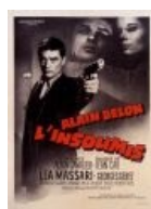
Делон туда же