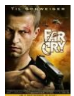
И Уве Болл