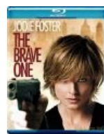
Не обошлось без барышни