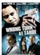
10 отличий искать будете?