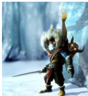
В Империи Зла Кенни убивает Ваc! Overlord II