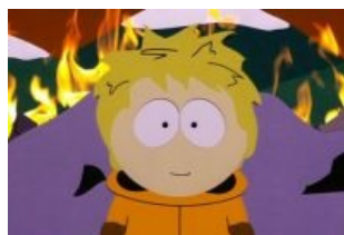
А на самом деле он такой