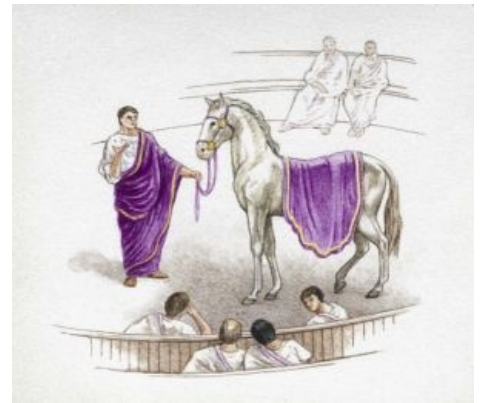
Калигула и его любимый конь

К Сенату Калигула относился с максимальным цинизмом, троллил его в хвост и в гриву. А Сенат, привыкший к показному флюордросу от Августа и Тиберия, в то время был штукой нешуточной. Калигула же откровенно посылал сенаторов нахуй и заёбывал их, как мог: заставлял бегать за своей колесницей по несколько миль, а за обедом стоять у его ложа, подпоясавшись полотном, словно рабы. Самым жёстким лулзом с его стороны было провозглашение любимого коняшки сначала гражданином Рима (в то время гражданство большинству подданных Рима не светило), а потом — полноправным сенатором. Конь натурально приходил в Сенат на работу, тусовался с сенаторами, и, наверное, двигал там какие-то телеги. Судя по всему — двигал дельно, так как император в итоге решил провозгласить его консулом, то есть главой всей этой богадельни. ИЧСХ, сделал бы, если б не принял ислам .