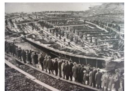
Калигула тоже хотел построить себе титаник