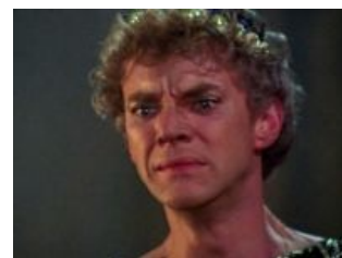
Малькольм МакДауэлл разочарован

EX DEO - I, Caligvla | Napalm Records Митол на тему