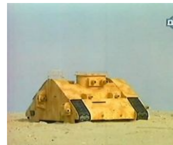
собственно вандервафля из рубрики