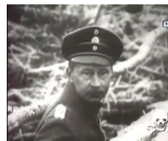
Угадайте кто? рубрика появилась в 1998!

Сие произведение комик-прома послужило лулзовым началом московского дуэта DBS, который дико доставляет своим олдовым ЕВМ-саундом и прикидами а-ля «хер майор» (кстати, песня с одноимённым названием тоже имеется), поют же парни на немецком языке с рязанским акцентом.