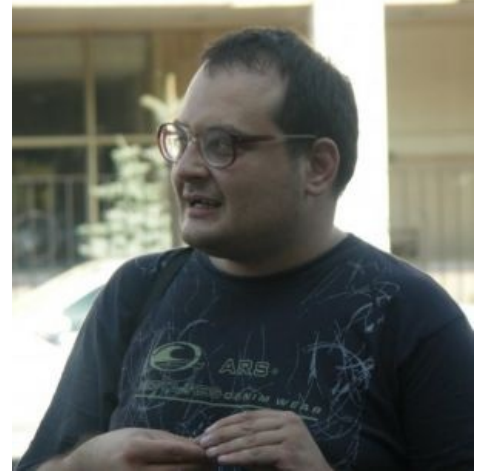
Каждан такой Каждан

Лев Маркович Каждан ( 👤 levkazhdan , 👤 nazhdak_vellesa , чаще всего подписывается просто Каждан) — еврозаец, суфодаохаст, специалист по синоизации (не путать с сионизацией!) всего сущего. Со временем его взгляды претерпели изменения в пользу хтонически-демонического иудаизма , потому нынче корректнее называть Каждана «демоническим иудеем». По собственному признанию, является рабом Яхве, но жутко обижен на него и поэтому служит «тёмным» богам Междуречья. Типичный представитель семейства ахтунгов , получивший солярную инициацию от самого Александра Гельевича . Владелец запущенного ФГМ в терминальной стадии, ымпераст .