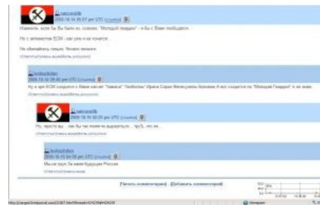
К вопросу смыслов