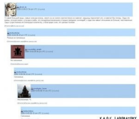
Информативная дискуссия с Кажданом

Нет,я просто по мироощущению язычник.Как и все подлинные манифестационисты.Мне обожествить человека вообще ничего не стоит.Особенно такого,как Вождь.Кстати,вера творит чудеса.Я вчера портерету Вождя на сайте Аркто помолился и мигрень прошла.Та самая,из-за которой я во время спора о Есенине невнимательность проявил.Прошу извинений у Ушкуйника.