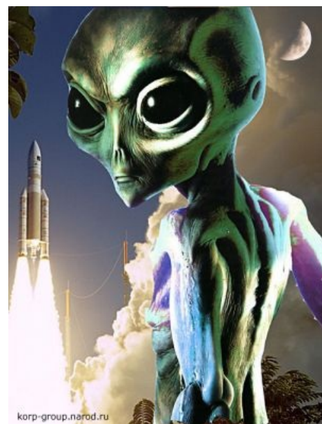
Сабж на фоне взлетающей ракеты

Ancient Aliens Debunked - (full movie) HD