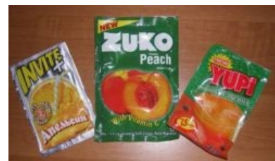
Те самые пакетики

«Инвайт» («просто добавь воды») — растворимый напиток, при разведении на два литра получается некое подобие газировки, но без газов, также есть ещё Zuko, Yuri, незабвенный Flavor Aid и Kool-Aid, любимый напиток ниггеров. В 2010-е на смену им пришли жидкие сиропы, например, SodaStream и Home Bar.