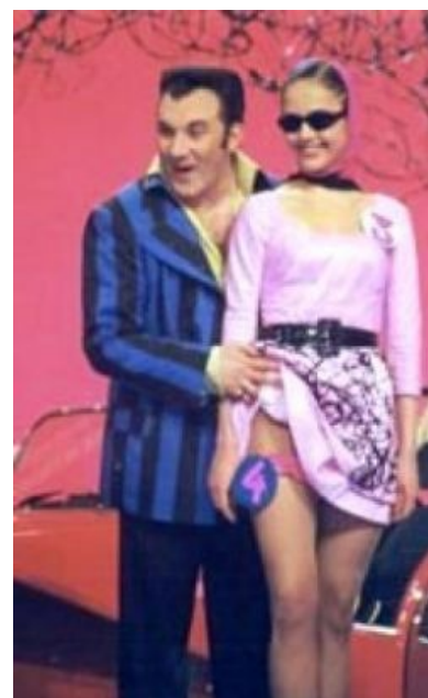
Кому-то придется снять четыре предмета одежды

Зрителями в студии были в основном люди в малиновых пиджаках , а также их содержанки . В одном из выпусков замечен человек кавказской национальности, похожий на молодого Сосо Павлиашвили . К сожалению, тогда Интернет ы были в зачаточном состоянии, и узнать, кто и как на самом деле участвовал