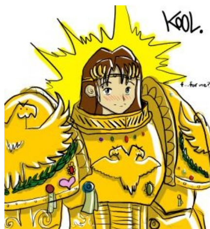
Император с точки зрения еретиков