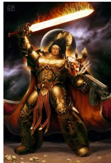
Император к началу Ереси Хоруса