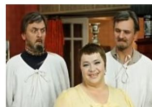
Тот самый кадр: «И меня вылечат»

Иван Васильевич меняет профессию (FullHD, комедия, реж. Леонид Гайдай, 1973 г.) Фильм.