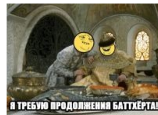
Желание царя — закон