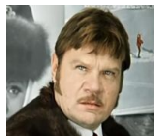
Goodnight, sweet prince