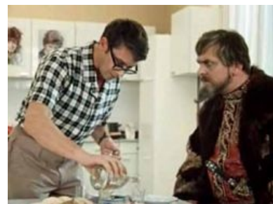
«Анисовой», к сожалению, нет...