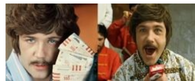
Продакт-плейсмент раз и два