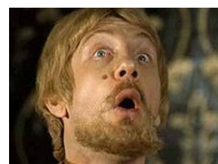
Интересная личность в XVI веке