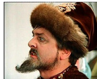
Иоанн Васильевич смотрит на текст как на холопский

Однако прогулка оказалась недолгой: происходит поломка (сгорают транзисторы ), вызванная воткнувшимся в машину бердышом . (В пьесе Милославского и Буншу выкидывает в прошлое после необдуманных действий управдома, который, пытаясь выключить машину, тычет наугад кнопки и вытаскивает из машины ключ запуска. Таким образом, Тимофееву приходится искать слесаря, чтобы сделать новый ключ). Герои путаются местами: царь оказывается в нашем времени, а засланцы — в XVI веке . Пока беглецы