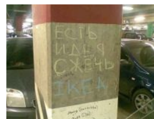
«Есть идея — сжечь ИКЕА»

А когда горе-строители таки претерпевают былинный отказ , шведское руководство начинает срать кирпичами и кричать, что-де во всем виноваты русские суки-чиновники, требующие взятку, и вообще, в эту вашу Рашку инвестировать невыгодно. ВНЕЗАПНО в 2014-м году было принято решение открыть 20 магазинов этой стране. 7 в Дефолт-сити, 3 в культурной столице и 10 оставшихся в этом вашем замкадье. Ну и ещё один охуеть какой большой склад в подмосковном Есипово, хотя там уже один есть.