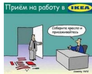
Собеседование в ИКЕА