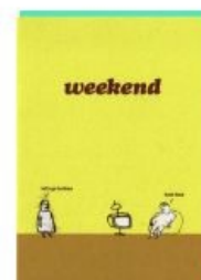
Здоровый британский нигилизм