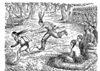
Девушка выскочила из пещеры и метнулась как стрела во главе, в поисках на ней.

Владимир Афанасьевич, описывая онкилонок, несколько раз замечал, что в жилище они ходят практически нагишом — только с узким пояском на бедрах. Что, впрочем, небезосновательно — у северных народов такое дело совершенно в порядке вещей. В финале романа именно поэтому академик Шенк сомневается, что фотография голой Аннуир может служить подтверждением существования онкилонов, ведь ее точно так же можно счесть и чукчанкой, и эскимоской.