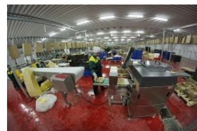
Основное место работы

Различаются по назначению, объёму, количеству сотрудников и оборудованию. Цехом может быть как старое кирпичное здание, в котором можно снимать фильмы 80-х , так и бетонные коробки (быстровозводимые профильные сараи на буржуйский манер, в которых летом жарко до сердечного приступа, зимой холодно до зубового скрежета, лишь только приоткроют высокотехнологичные ворота, и до простуды, если их совсем сломают), оборудованные изнутри самым что ни на есть хай-теком. Так как экономика должна быть экономной (это сказал ещё дорогой Леонид Ильич ), то в некоторых цехах решили провести такой интересный эксперимент, чтоб сэкономить хотя бы свет — врезали в крышу