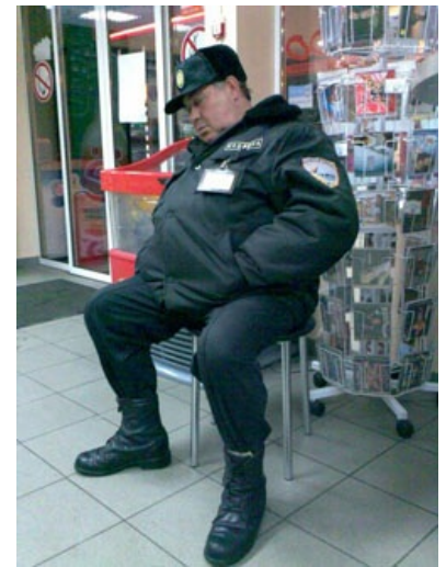
На страже порядка