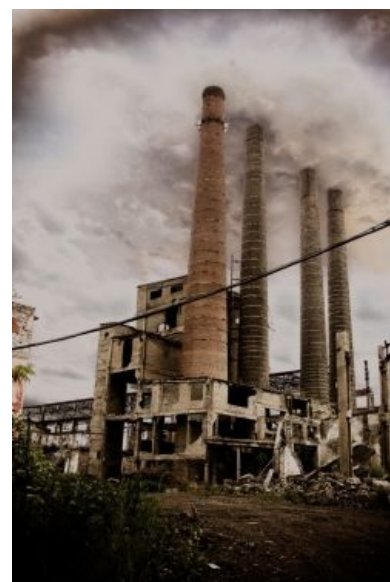
Уже заброшенный завод

В той стране , которая, как известно, и принадлежала этим самым рабочим и крестьянам, а управлялась кухарками, заводы были важной её частью, так как на них работала и производила, может быть, даже что-нибудь ненужное, большая часть населения той страны. После такого развлечения, как гражданская война , значительная часть заводиков была официально разрушена, а их оборудование устарело; неофициально же попросту скоммунизжено. Нужно было что-то делать и, не мудрствуя лукаво, Отец народов решил взять курс на индустриализацию, а для этого: ободрать церкви под предлогом б-гоборчества, произвести анальные раскулачивания и коллективизации в деревне, заморив колхозников голодом, вытрясти всё золотишко из заначек населения, вынудив его отдать буквально за еду и продать буржуазные чуждые произведения искусства, а на вырученную с продажи лута валюту закупить станки и оборудование и построить эти ваши заводы. Также ему помогла Заграница, в которой ВНЕЗАПНО настал лютый кризисец, лютый настолько, что, несмотря на «признание Америки» [2] , жрать буржуйам что-то надо было, и многие из них вербовались на работу в СССР, где, конечно, добровольно