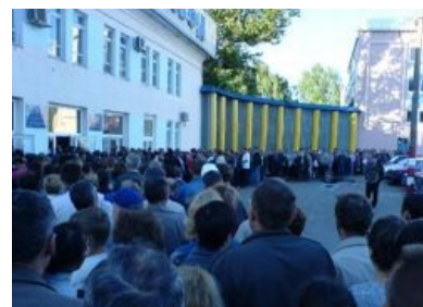
Очередь на проходную Чебоксарского агрегатного завода. Это вам не уютный офис

Проходные оборудованы турникетами (иногда даже работающими) и толпой охраны , воплощающей в себе концентрированные ФГМ и вахтерство . Дело усугубляется пропускным режимом: для многих будет сюрпризом узнать, что выйти с завода во время рабочего дня представляет определённую проблему. И сделать это можно только в случае особого пропуска (как