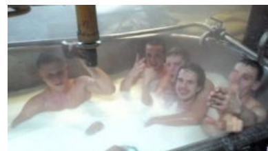
Омский сырозавод: молочные реки, кисельные берега

Заводы по производству нямки. Поэтому для работы на них обычно требуется санкнижка. Впрочем, она не исключает антисанитарию на заводе: от испражнений в готовый продукт (гранулированный корм для скота) до воровства. Причём в последнем речь не о банальных несунгах, а о шишках покруче, которые закупают ништяки по заоблачным ценам или продают товар по заниженной цене, а разницу кладут себе в карман. Или вот есть тоже интересная игра «Найди крайнего»/«Прикрой свою жопу», благодаря которой козлом отпущения за крупный косяк становится не тот, кто его совершил, а безропотный работяга. Или, если руководство гуманное, «технический сбой/недоработка». Впрочем, бывает, виноватых вообще не находят, но это редко.