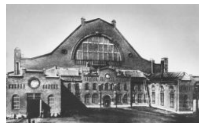
Путиловский завод, именно отсюда пошла такая зараза, как коммунизм