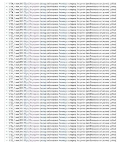
Окончательное решение китайского вопроса