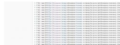
Окончательное решение китайского вопроса

AlexSword Avanturist Butthurt Check you DDoS Encyclopedia Dramatica/Атеист Fandom Grammar nazi IQ Livejournal.com Mac vs. PC S Special Olympics TeX X не умер Аборт Автосрачи Адекватная точка зрения Активная гражданская позиция Алкснис Аргументация в полемике Армата Арнольд Зукагой Артефакты Петербурга Атеизм Атеизм/Orthodox Edition Бесплезная наука Битва слона с китом Бодибилдинг Боклааноцитт Бокс по переписке Ботинкометание Бульбосрач Бурление говн В/на Вайп Вандализм Ванкувер 2010 Леонид Василевский Вброс говна в вентилятор Веганы Великая Отечественная война Взлетит или не взлетит? Винофилия ВиО Война правок Война пятницы тринадцатого Георгиевская ленточка Глобальное потепление ГМО Гоблин Говнарь Гогисрач Градус неадекватна Гражданская война в России Гринпис Демотивационный постер Детерминизм Диалог с собой Диванные войска Дружба между мужчиной и женщиной Дыхота Евромайдан Европейцы ли русские? Еда Жанроздротство Женская логика Женя Духовникова Жестокость в компьютерных играх