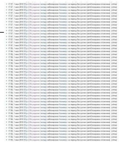
Окончательное решение китайского вопроса