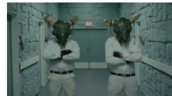
Персонал глазами пациентов

Большинство персонала отличаются от пациентов только наличием халата. Медсёстры — в большинстве своём милые девчонки слегка за семьдесят, с лёгкой формой шизофрении, наложенной на старческий маразм. Чем меньше удастся с ними контактировать, тем лучше — сливают всю инфу лечащему врачу. Санитары — уголовного вида садисты, только и ищущие повод засадить вас в надзорку (палату усиленного наблюдения). Используют армейские приемы дедовщины. Врачи — коварные коршуны, которые видят во всех психов, даже за пределами больницы. Обязательно найдут у вас «социально опасную» болезнь, будь вы хоть Папой Римским и Махатмой Ганди в одном лице. Более того, они этих Пап Римских вкупе с Александрями Македонскими и так каждый день видят. Ты ещё хочешь откосить от армии по дурке?