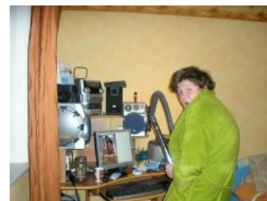
Все параграфы соблюдены