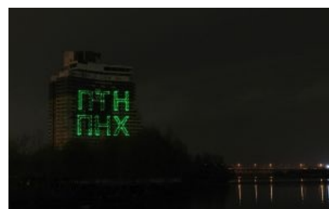
Руны древних укров, с помощью