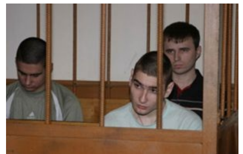
Сферические маньяки в вакууме суде