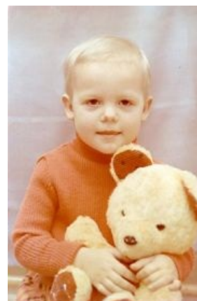
На радость Педобиру .