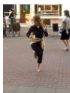
Суровая реальность сурова