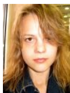
Фото Джипси в ГЕО