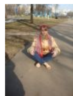
Так делать вредно!