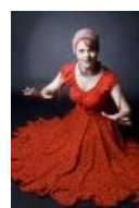
Н. Кидман в роли Джипси