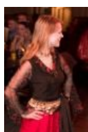
Гляди в центр