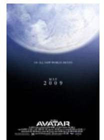
Фейк-постер намекает: дедлайн прослан.