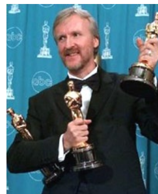
Ну и куда их все девать?

Понадобилось снять кадр — оторванная полуразложившаяся максимально отвратительная рука крупным планом. Кэмерон решил картинку разнообразить — добавить в нее извивающихся червей. Вместо реальных мясных червей нарыл где-то жирных опарышей, насовал в латексный муляж руки. Те, сволочи, лежат и еле шевелятся, извиваться