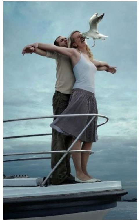
Романтега в Титанеге.