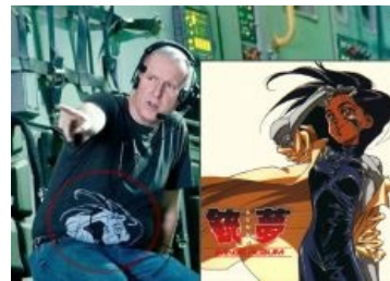
Ага, вот это аниме сейчас станет фильмом.

Ещё с 90-х Кэмерон грозился снять фильм « Алита: Боевой ангел », но всё время отдвигал съёмки на потом. Необычность задумки заключалась в том, что первоисточником служит тут совсем не американская, а очень даже японская манга в стиле киберпанка — « Gunnm » (более известная под названием « Battle Angel Alita » [1] ), в своё время просто таки уёбишно и не до конца [2] экранизированная в виде аниму . Стоит заметить, что сюжет телесериала Тёмный ангел , спродюсированный Кэмероном же, отдалённо напоминает сюжет манги, а характер, способности и внешние данные главных героинь, практически совпадают, что как бы намекает . Проект неоднократно отсрачивался по причине съёмок Аватара II, III и IV, а маэстро грозился, что до своей смерти вряд ли кому-то отдаст права, но эпопея про синерожиж оказалась всё же важнее.