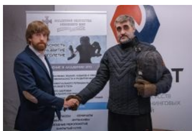
В гостях у ФСБ